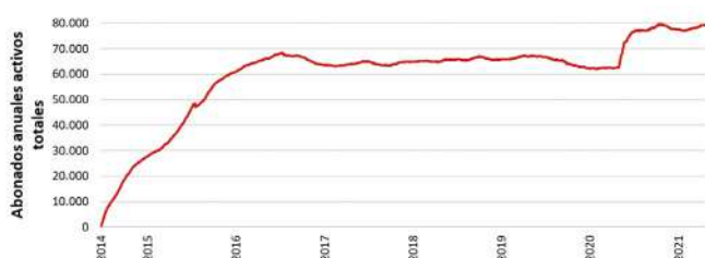
Figura 1 Evolución del número de usuarios abonados anuales activos totales de BiciMAD.

A pesar de no ser una ciudad con una orografía demasiado favorable para ser transitada en bicicleta, BiciMAD ha visto aumentado el número de usuarios totales desde su inicio. Podemos distinguir cuatro fases principales en su evolución (Figura 1):