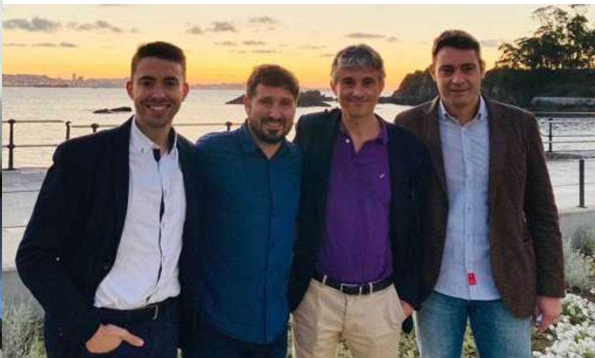
XI CONGRESO IBEROAMERICANO DE ECONOMÍA DEL DEPORTE