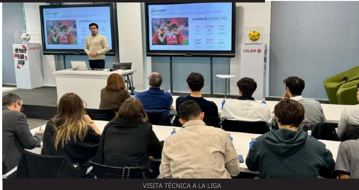
VISITA TÉCNICA A LA LIGA

proceso, en el que se puede llevar a cabo la fabricación de elementos, tales como mesas, taquillas etc, a partir del reciclaje de los residuos generados por las propias entidades. Además, de ser una jornada de aprendizaje, sirvió como punto de encuentro entre los diferentes gestores de entidades públicas y privadas de la Comunidad de Madrid.