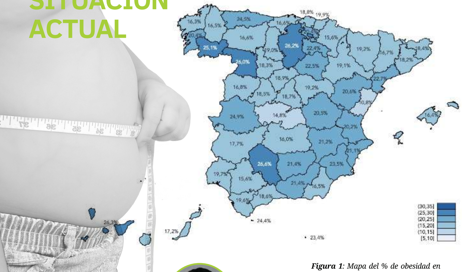
Figura 1: Mapa del % de obesidad en las comunidades autónomas entre los participantes de la encuesta.