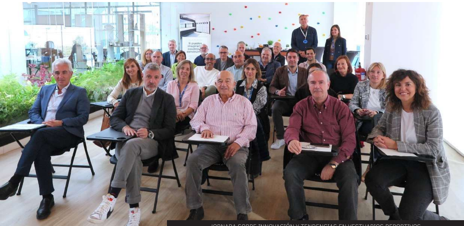
JORNADA SOBRE INNOVACIÓN Y TENDENCIAS EN VESTUARIOS DEPORTIVOS